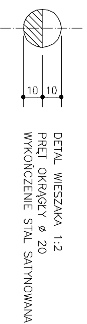
DETAIL WIESZAKA 1:2 PRET OKRĄGŁY Ø 20 WYKOŃCZENIE STAL SATYNOWANA